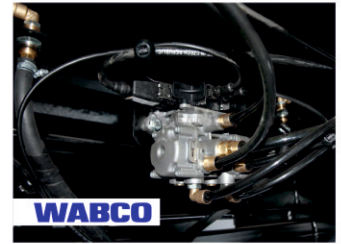
Рабочая тормозная система - WABCO , пневматическая, двухконтурный привод раздельно к тормозам передних и задних колес, тормозные механизмы барабанного типа на всех колесах, ABS .