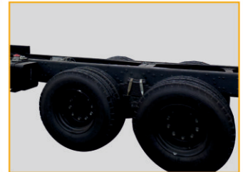
Шасси изготовлена по технологии тяжелой автомобильной техники MAN (Германия).