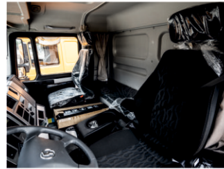
Комфортная и просторная кабина, изготовленная по технологии MAN